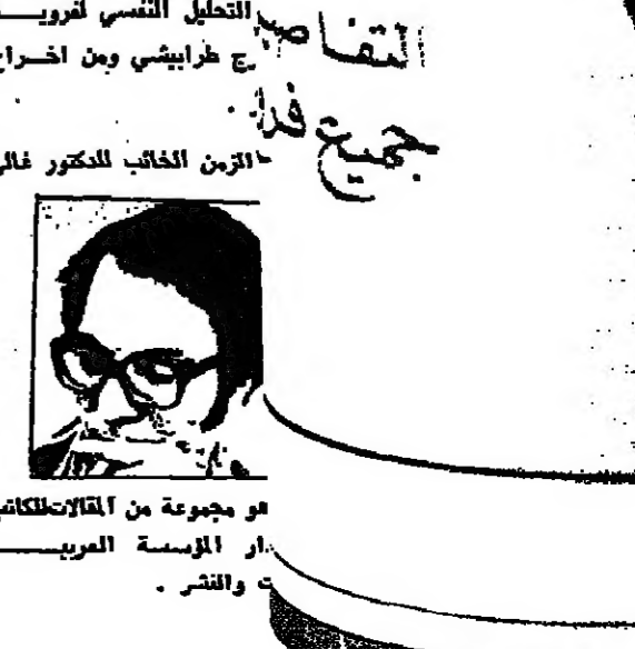
هو مجموعة من المقالات المكتوبة او اللمسة العربية والنشر ..

كوب لوفاية وبيبتك المسة ، ولكلك التحليل التمسى لقرويد ج غرايبشى ومن اخراج جميع فذ الذين الخائب للكور غالي